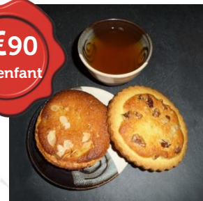
Dégustation médiévale ou goûter ardennais