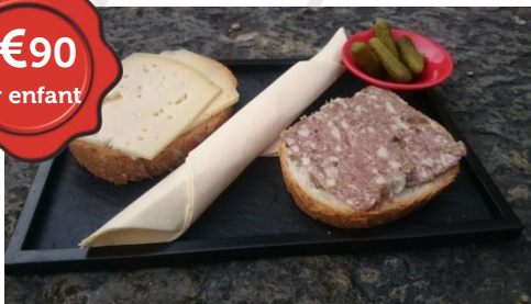
Repas Tartines Ardennaise ou pique-nique au Château