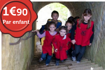
Location de surcots