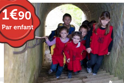
Location de surcots