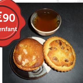
Dégustation médiévale ou goûter ardennais