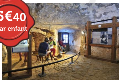
Visite 1000 ans d'histoire